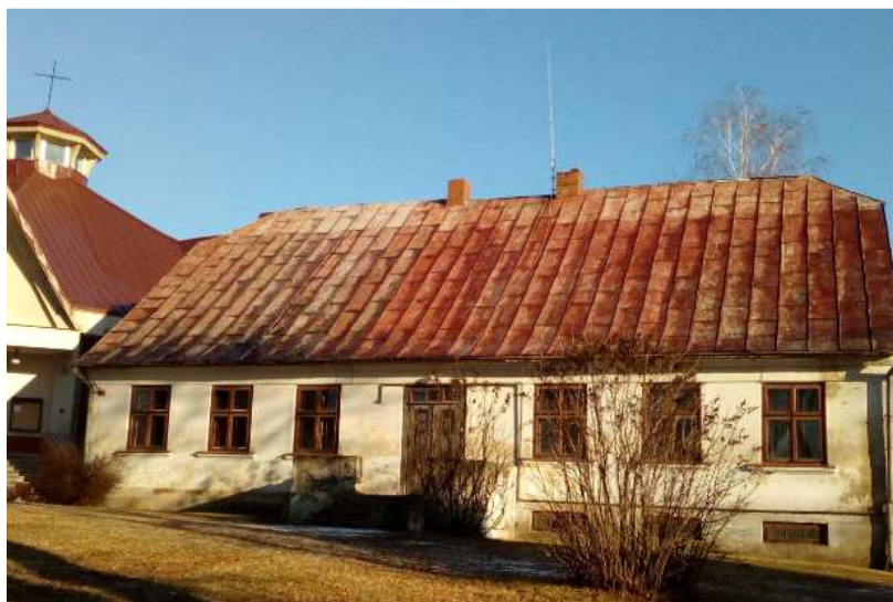
Fot. 3. Dawny Dom Pastora w Nowosolnej. Stan na 2016 r.

Kolejnym elementem zespołu kościoła ewangelickiego w Nowosolnej jest dom pastora (fot. 3), zbudowany w 1856 r., obecnie pełniący funkcję plebanii przy kościele rzymskokatolickim 50 . Dom zaprojektowano na planie prostokąta o konstrukcji szerokofrontowej, symetrycznej, dwutraktowej. Obiekt murowany, otynkowany. Jako jedyny z całego zespołu został podpiwniczony. Dach o konstrukcji krokwiowej na pojedynczym stolcu został pokryty deskami i blachą. Budynek posiada drzwi i okna wykonane z drewna. Płaszczyzna ścian zwieńczona została gzymsem. Obecnie nie zachował się dawny rozkład wnętrza. Na miejscu pieca chlebowego zrobiono łazienkę. Wprowadzono dodatkowy podział: w kuchni wydzielono spiżarnię, w pokoju od frontu zrobiono kancelarię oraz dobudowano niewielki taras ze schodkami. Od północno-wschodniej strony dobudowano przybudówkę, pełniącą funkcję sieni. Wejście znajduje się w północno-zachodniej części budynku. Po obu stronach drzwi znajdują się po trzy okna dwudzielne. Drugie drzwi wejściowe oraz identyczny rozkład okien znajduje się także od strony południowo-wschodniej budynku. We wschodniej ścianie domu pozostało jedno okno (resztę zamurowano). W północno-zachodniej części szczytowej budynku ulokowano okno oraz dwa symetryczne kwadratowe świetliki, które ozdobiono zamkniętą łukiem 51 .