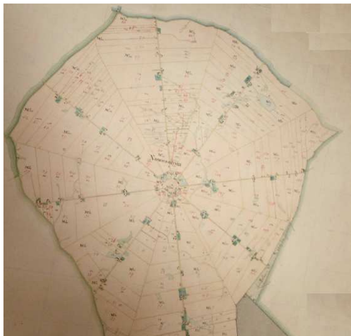
Fot. 1. Nowosolna. Układ przestrzenny kolonii z poł. XIX w.