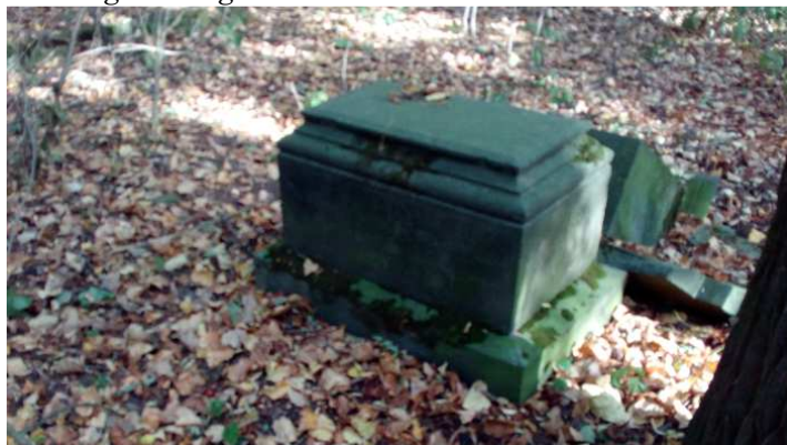
Fot. 4. Pozostałości nagrobków na cmentarzu w Wiączyniu Górnym. Stan na 2016 r.

Mimo ogromnych zniszczeń, cmentarz ewangelicki pozostaje cennym świadectwem kultury materialnej ludności zamieszkującej niegdyś wsie fryderycjańskie. Obiekt jest obecnie nieczynny z powodu odpływu z analizowanego obszaru, po II wojnie światowej, ludności wyznania ewangelickiego.